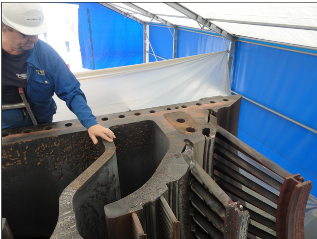
Det skadade delningsplanet.

Vi utförde uppdraget med att termiskt spruta skadorna och därefter planfräsa de sprutade områdena med mobil fräsutrustning. Stork Technical Services GmbH hade totalansvaret för hela turbinöverhållningen.