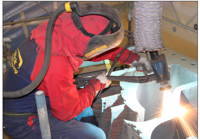
Termisk sprutning av skadorna