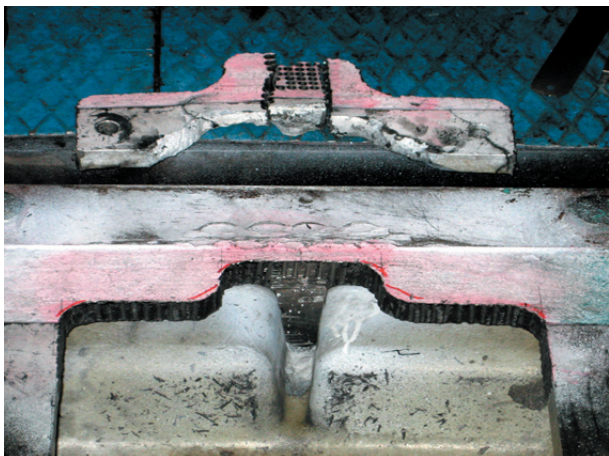
Skadad del i bottenramen togs bort