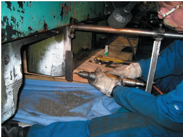
Bortbearbetning av skadad del på manlucka

Tidsåtgången för reparationen, som skedde under gång, var ca 2 veckor.