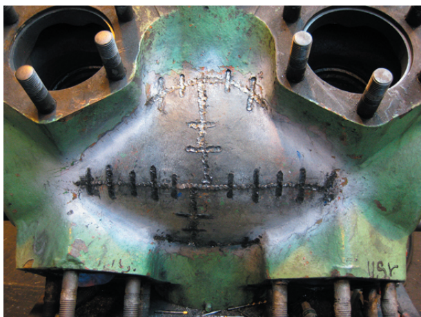
Tätning och fixering av sprickan