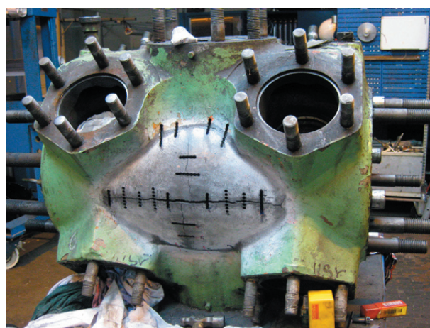
Låsning av sprickorna