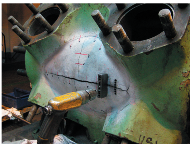
Urborrning för metallocklås

Reparationen, som utfördes i kundens verkstad, tog totalt ca 35 timmar.